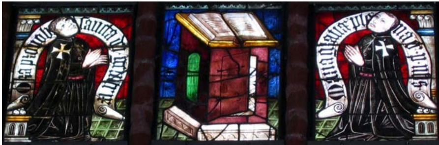
Zwei Johanniterbrüder verehren betend die Heilige Schrift: Fenster im nördlichen Nebenchor der ehemaligen Kommenden-Kirche St. Johannis in Werben, um 1380

Gott, du kennst unser Herz. Wir bringen dir unsere Anliegen und alle, die uns am Herzen liegen.