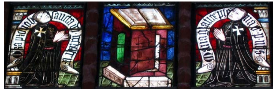
Zwei Johanniterbrüder verehren betend die Heilige Schrift: Fenster im nördlichen Nebenchor der ehemaligen Kommenden-Kirche St. Johannis in Werben, um 1380

Jesus, sende uns deinen Heiligen Geist – damit wir dich erkennen, verstehen und dir nachfolgen.